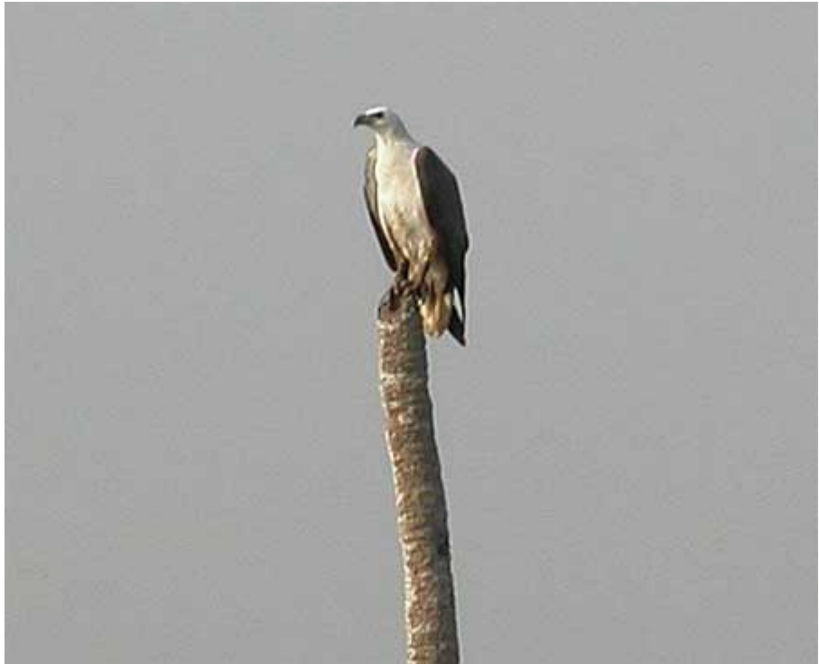
White-bellied Sea Eagle, Zuari River

Crested Serpent Eagle 2 Backwoods, 2 Goa Velha, 1 Mayam Lake.