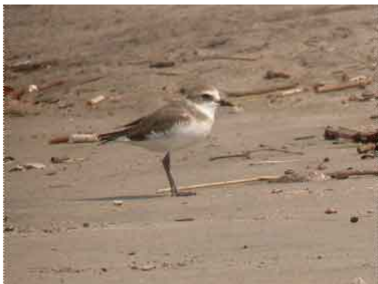
Mongolsk Præstekrave Morji Beach

Lesser Sandplover / Mongolsk Præstekrave ca. 40 på stranden Morji Beach, også flokke langs Zuari River.