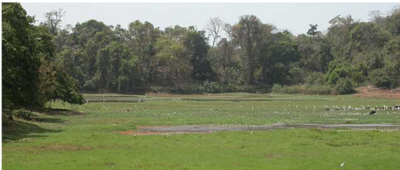
Pilearma Lake med forskellige hejre og vandbøfler

Et udmærket område med mange forskellige ande- vadefugle og hejre. Det var det eneste sted jeg så lesser adjutant. Blev besøgt med taxachaufføren Victor.