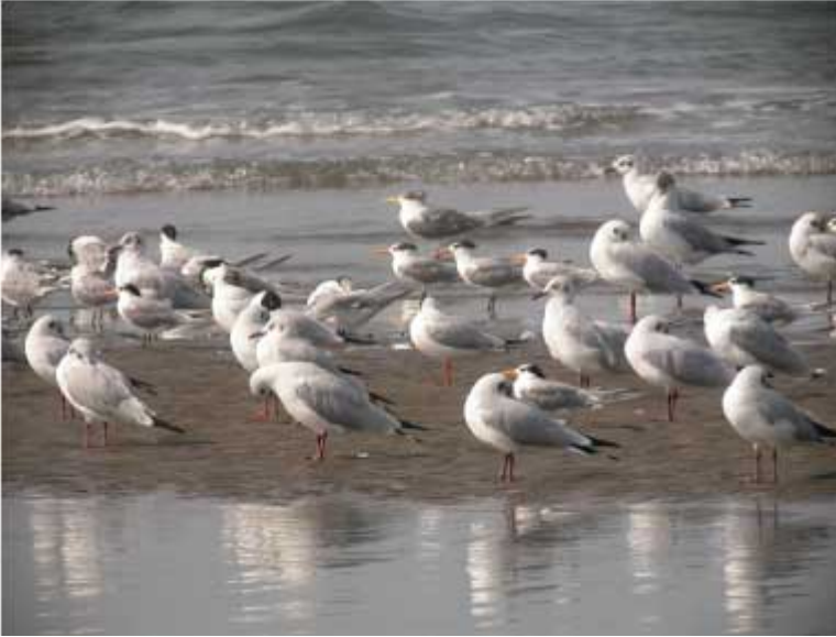
Bengalsk og bergius terne samt brunhovedet måge Morji Beach

Lesser Crested Tern / Bengalsk Terne 65 Morji Beach, 2 Zuari River.