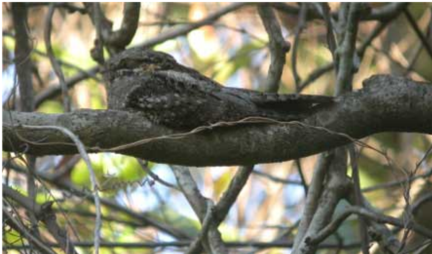
Grey Nightjar Baga Hill

Et mindre højdedrag lige nord for Baga, nederst bevokset med kratkov, øverst åbent plateau. Vi besøgte det 3 eftermiddage. Indisk Påfugl er almindelig, vi så også et par vagtler, som vi bestemte til Rain Qual. En taxachauffør – Victor – viste os en Grey Nightjar som havde en fast dagrasteplads på en gren.