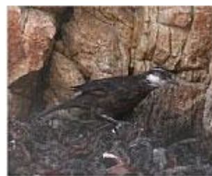
Chilean seaside Cinclodes

Vermilion Flycatcher 2 Azapa Valley 10/11 + 3 d. 11/11, 1 Lluta vally munding 11/11, 2 Lluta Vally 12/11 + 2 d. 15/11